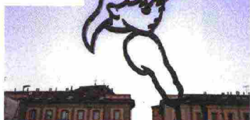
La scultura Alba di Valerio Berruti.

Se una gita autunnale vi portasse nelle dolci Langhe, in una sosta nella cittadina di Alba, la rinnovata piazza Ferrero ha una novità: nel suo profilo di oltre 12 metri, l'omonima opera Alba dell'artista Valerio Berruti porta all'orizzonte una scultorea poesia.