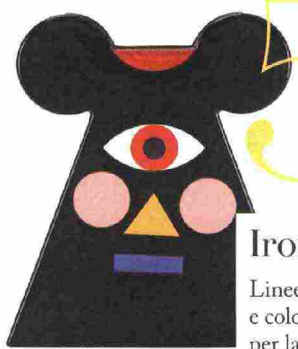
Un vaso di Marco Oggian per Queebo.