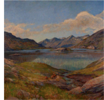
L'incanto del paesaggio. Naturalisti, geografi, storici dell'arte nel Ticino del passato prossimo

Fino al 22 ottobre debutta Manibus Focus Week presso il Teatro Sociale di Fasano. Oltre alle mostre in corso, viene proposto un ricco programma mattutino di Master Class e la sessione pomeridiana di Lectiones Magistrales, con approfondimenti condotti da eccellenze della cultura d'impresa nei campi di arte, impresa, artigianato, design e stili di vita