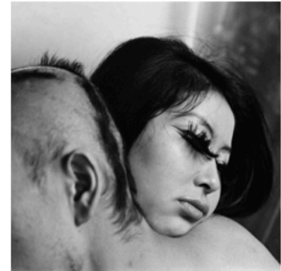
Tokyo Revisited. Un viaggio lungo quanto una vita: Moriyama e Tomatsu al MAXXI